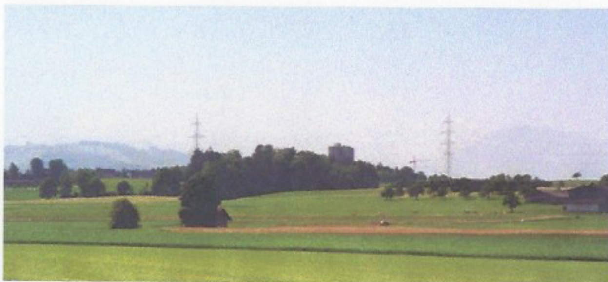
Blick gegen Westen mit Hochhaus in Hünenberg. Aus diesem Blickwinkel ist der Bau eher ein Fremdkörper im Landschaftsbild.

Gesamtbeurteilung: keine zusätzlichen hohen Gebäude möglich